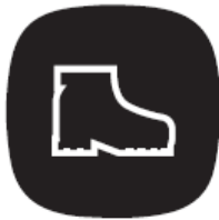
Botas (preferentemente de seguridad)